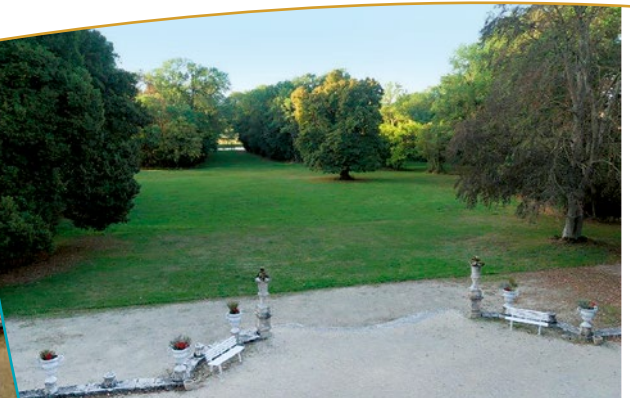
Vue sur le parc