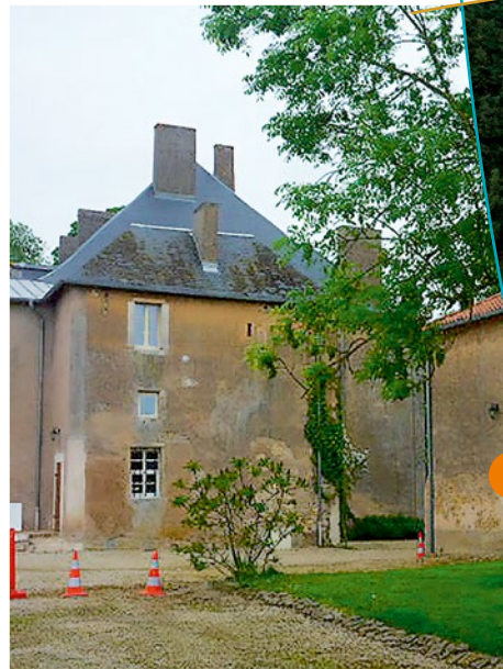
Aile Ouest du château

Cet ensemble fut réalisé sur les ruines d'une ancienne seigneurie, acquise le 31 juillet 1700 par Claude Marcel de Rutant. Il aurait fait raser cette seigneurie pour vice de forme et il a édifié le château actuel durant les années 1730 à 1733. Le constructeur en serait Orphée de Galéen, architecte au service du duc de Lorraine. Le château se compose d'un corps central important à deux niveaux d'habitation, flanqué de deux bâtiments en retour sur la cour d'entrée. Ces deux bâtiments sont à usage de dépendances. La composition du parc est faite sur les principes du jardin à l'anglaise.