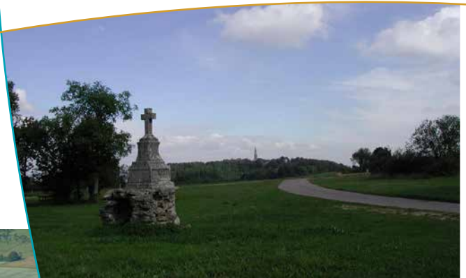
Croix Sainte Marguerite