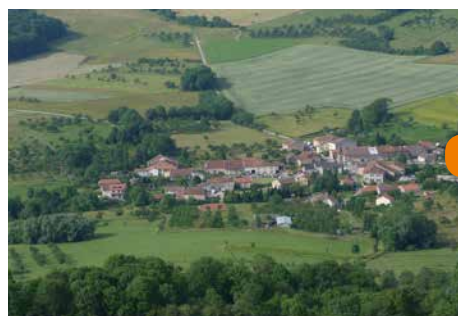
Petit village rural de Gugney au pied de la colline

Ce site est complété par la croix Sainte Marguerite, également classée.