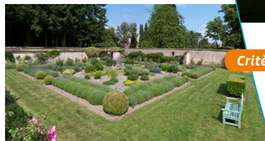
Les jardins du château

Le site se prolonge sur la vallée de la Mortagne, modelée par le cours très sinueux de la rivière et la succession de prairies et de champs, ponctuée par des rideaux successifs d'arbres et de boqueteaux.