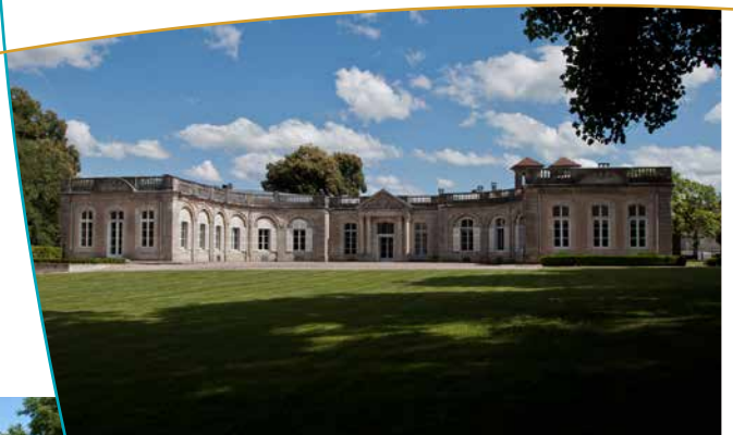
Le château vu depuis le parc