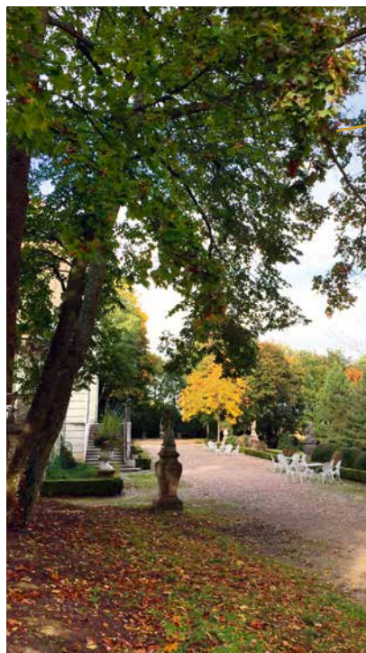
Le château de Montaigu, au sud-est du parc

Située presque en vis-à-vis du musée du fer, cette bâtisse a été construite par Bon Prévost, receveur général des fermes de Lorraine. Le domaine fut complété en 1765 par un ensemble important de dépendances : orangerie, écurie, pigeonier et ferme. Le parc comprend également une chapelle qui évoque les nombreux ermitages qui virent le jour autour de Nancy au 17 ème siècle ainsi qu'un plan d'eau. Le château a été la demeure d'Edouard SALIN (1889-1970), ingénieur métallurgiste, archéologue et homme de lettres. Le parc, propriété de la ville de Nancy, est un lieu de promenade bien apprécié. Il fait l'objet de nombreuses restaurations afin de lui restituer toutes ses qualités.