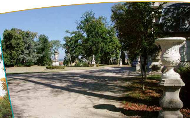
Le parterre devant la façade ouest du château