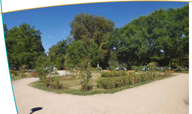
Un des massifs de roses