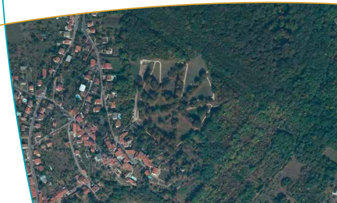
La Pelouse vue du ciel et son agencement de tilleuls très caractéristique