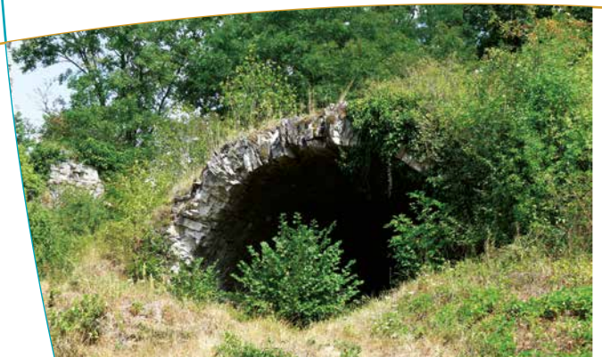
Ruine de l'ancienne salle voutée

Il est difficile aujourd'hui de reconnaître le dessin d'une forteresse dans les restes de murs, les arrachés de voûtes, les tas de pierres émergeant des éboulis sous une végétation dense. Pourtant les éléments sont encore là : les murs du donjon circulaire épais de 4 mètres, des pans de murs des courtines et des logis, des salles voutées en partie effondrées, des ouvrages extérieurs recouverts de terre et de végétation.