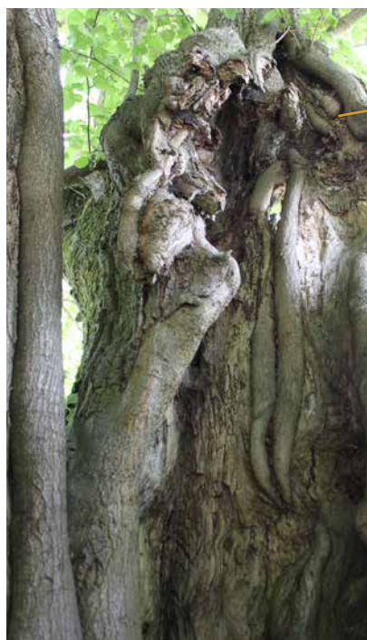
Tronc creux du tilleul

Presque un siècle plus tard, il n'a rien perdu de sa superbe, puisqu'il présente aujourd'hui encore une hauteur de plus de quinze mètres et un feuillage abondant témoignant de sa bonne santé.