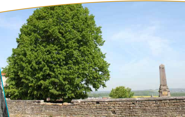
Tilleul embrassant le grand paysage