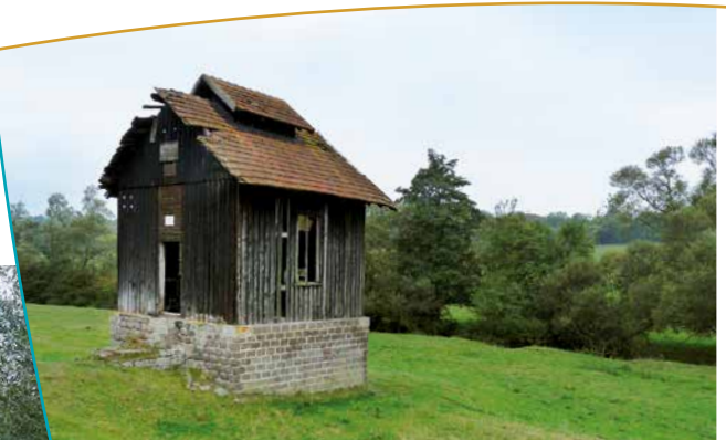
Paysage Vallon de la Roanne