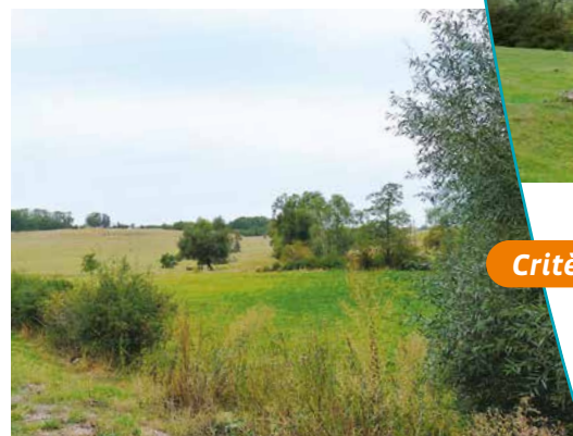
Paysage Vallon de la Roanne

1845 à la Société des Rosières – Varangéville, puis en 1855 à la Société Daguin et Cie. Ce site garde le témoignage de l'avènement de l'ère industrielle et d'une industrie de base dans la vieille Lorraine rurale.