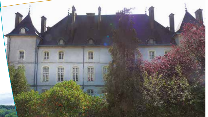
Château de Vandeléville