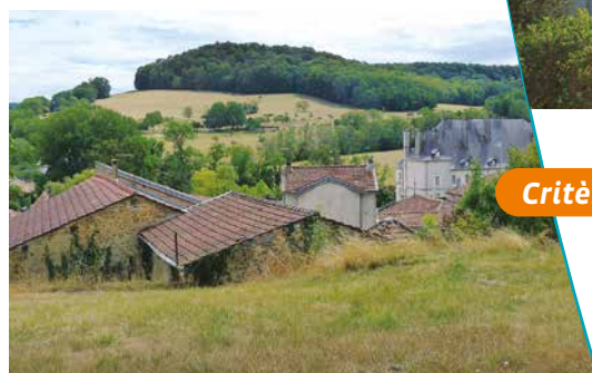
Vue sur Vandeléville

Le château, imposante construction du début du même siècle, couvert d'un haut toit d'ardoise et d'une sévérité sans décor. Ses dimensions sont sans rapport avec les autres édifices et semble vouloir faire contrepoint à la topographie. Enfin, la ferme attenante, de la même époque, en forme de U avec son colombier.