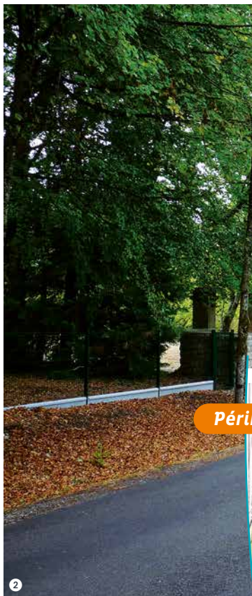
1 à 2 ~ Allée des Tilleuls