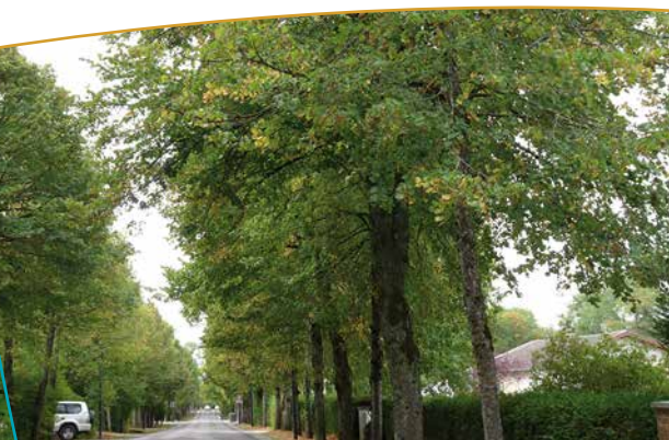
Allée des Tilleuls