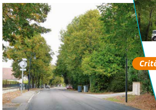
Allée des Tilleuls

En 1805, l'allée des Tilleuls fut renouvelée par l'implantation de 250 tilleuls. Accès direct et pittoresque à la Ville Haute, l'avenue était, pour nombre de Barisiens, un lieu de promenade de proximité, agrémenté de jardins et de petites propriétés secondaires. Ces arbres constituaient une magnifique allée, qu'embaumaient, en été, leurs floraisons abondantes et qu'illuminaient, à l'arrière saison, les teintes somptueuses d'automne. Mais les rangs se sont fortement éclaircis. L'avenue a fait l'objet de réaménagement ; de nouvelles plantations ont été réalisées. Il faudra attendre quelques décennies avant que l'avenue retrouve son alignement majestueux.