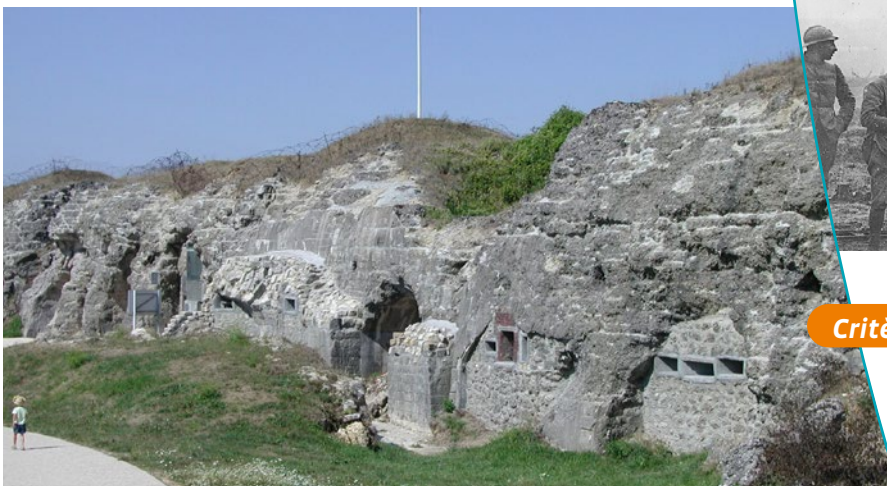
Fort de Douaumont