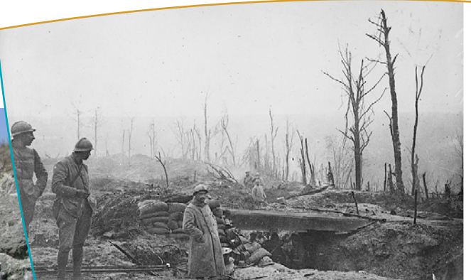
Photo ancienne témoignant de l'horreur des combats