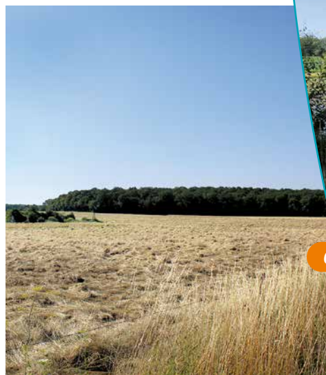
Vue sur la forêt domaniale des Haudronvilles

L'ensemble des étangs de Lachaussée comprend, en plus du grand étang principal, une quinzaine de petits étangs annexes, ainsi que les quatre villages les plus proches, et les boisements alentour. Ceux-ci contribuent aux paysages du site, vastes étendues faiblement ondulées où miroitent dans les fonds les étangs cernés de forêts et où se perd, de loin en loin, la silhouette des villages et des fermes isolées. Créés sur une zone plate et marécageuse, en bordure orientale de la plaine argileuse de la Woëvre, ils forment la transition avec le plateau, qui est le revers des côtes de Moselle. Aujourd'hui conquis par une riche biodiversité, il s'agit de l'un des premiers écosystèmes en Europe pour l'avifaune.