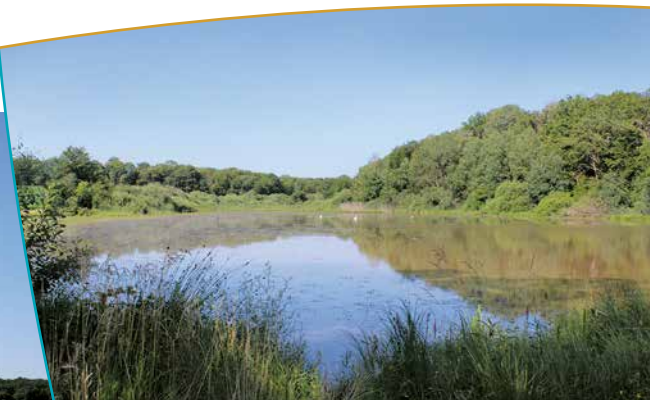
L'étang Belian en bordure de la RD904