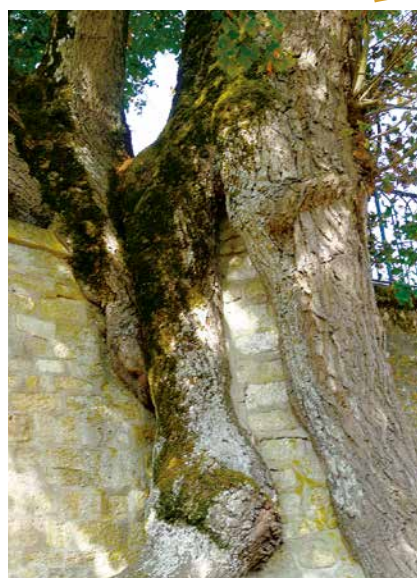
Fût du tilleul pris dans le mur

Il s'intègre très bien dans ce site qui offre de plus un beau point de vue.