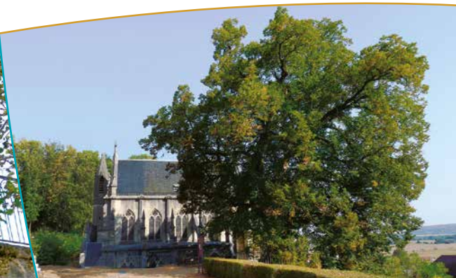
Tilleul avec vue sur la chapelle castrale