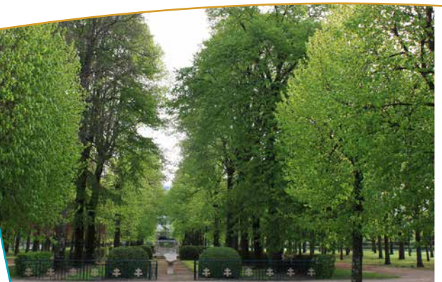
Square des anciens combattants