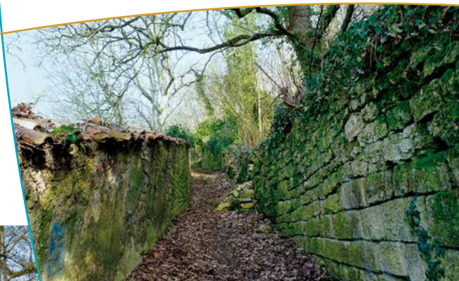
Muret de Pierre sèche - ruelle vers la Promenade des Capucins