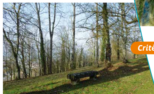
La Promenade des Capucins en hiver

couraient dans les grandes allées. Des kermesses, un bal au lieu dit du "Rond Point", des attractions foraines, animaient les dimanches après-midi. Après 1945, cet espace de verdure a été peu à peu déserté avant d'être de nouveau fréquenté par les samiellois mais également les visiteurs de passage.