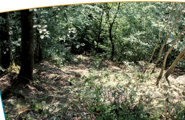
Vue du dénivelé du rocher depuis le sommet