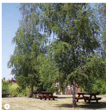
1 - 2 - 3 - 4 ~ Terrasse de Beaulieu