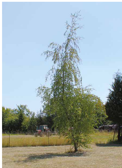
Terrasse de Beaulieu

La terrasse de Beaulieu, que les habitants connaissent plus particulièrement sous le nom de « Potager », est située, de même que le village, sur une cuesta. La terrasse est limitée sur l'un de ses versants par le « Mur des Moines », mur de petites briques rouges, d'une épaisseur de 7 mètres. Dans le sous-sol, des sondages ont permis de situer des souterrains, sur deux niveaux. Ce site, excentré du "village rue" et dépourvu de construction, constituerait sans doute un beau belvédère d'où l'on pourrait avoir une belle vue, s'il n'était pas bordé de grands arbres et de végétation touffue.