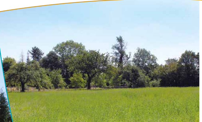
Terrasse de Beaulieu