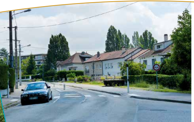
Rue Villers l'Orme devant le site classé