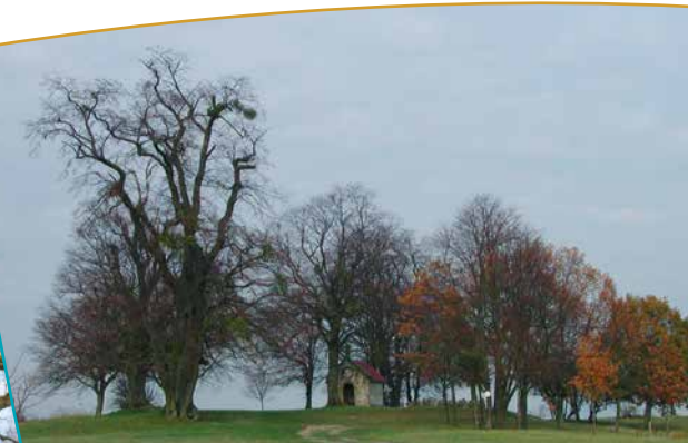
Vue sur la chapelle et les arbres qui l'entourent