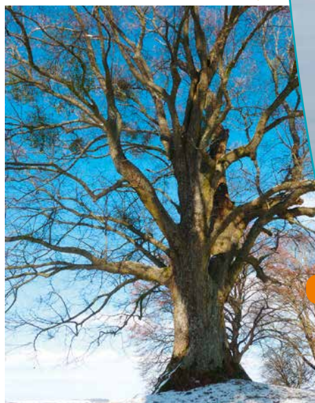
Vieux tilleul à proximité de la chapelle

Cette colline appartenait historiquement au Ban de Saint-Pierre, haut lieu païen siège d'une seigneurie lorraine enclavée au milieu des terres de l'évêché de Metz, qui fut finalement cédé au roi de France en 1718. Au VI ème siècle fut érigé un temple qui fut rattaché par la suite à l'abbaye des religieuses bénédictines de Saint-Pierre-aux-Nonnains, l'une des plus anciennes de Metz. Cette église fut détruite en 1854 et remplacée par une chapelle en 1865. Aujourd'hui un mémorial, en forme de croix de Lorraine, statue à l'extrémité ouest du sommet, en l'honneur de tous les combattants de la seconde Guerre Mondiale.