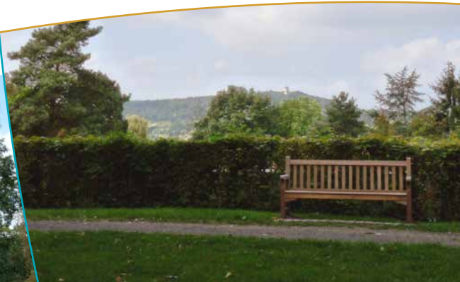
Vue sur le Mont Saint Quentin