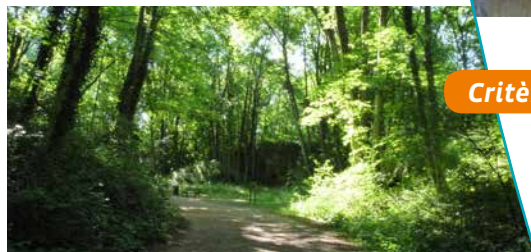
Le fort aujourd'hui boisé

Les abords du fort sont aujourd'hui très boisés, aménagés en parcours de santé. Il s'agit de lieu de promenade agréable, cœur de verdure et de biodiversité à proximité directe de la ville.