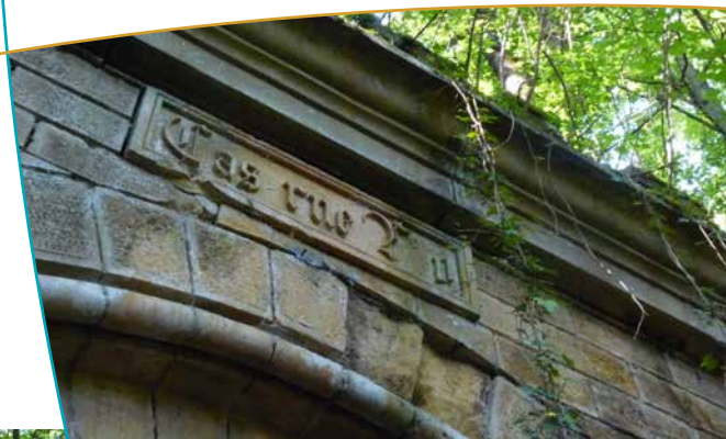
Aile sud du fort, aujourd'hui à l'abandon