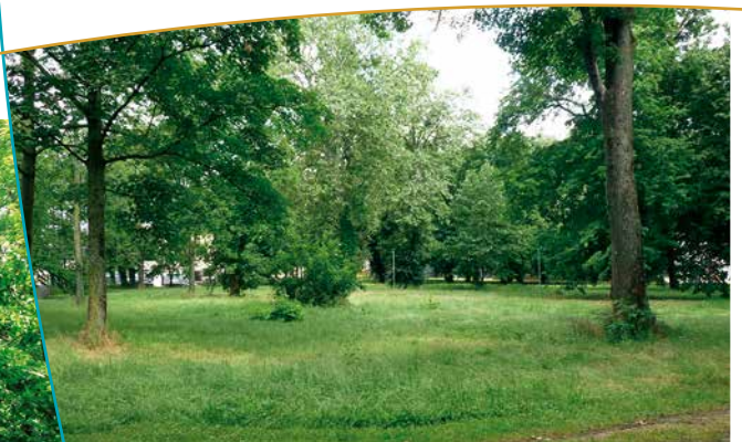
Vue sur l'île Saint Symphorien