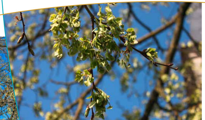
Fleurs de l'Orme