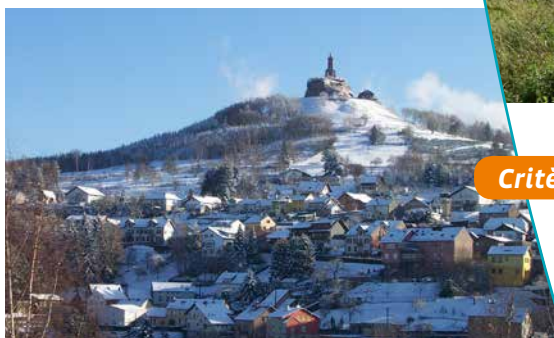
Le rocher, sous la neige

Ce site combine plusieurs attraits et offre une vue imprenable sur le plateau lorrain et la ligne bleue des Vosges aux sommets couverts d'immenses forêts.