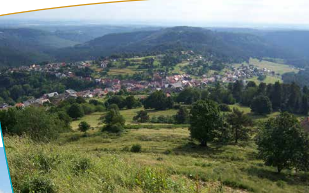
Vue depuis le rocher sur la commune de Dabo