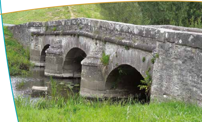
Détail du pont sur le Landbach

Aujourd'hui propriété de la ville de Sarrebourg, l'ancien couvent abrite le Centre International des Chemins du Baroque, créateur et partenaire de nombreuses manifestations musicales et culturelles au Pays de Sarrebourg.