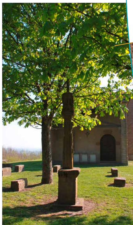
Stèle ou "Bildstock"

Le sous-sol du territoire renferme le fort de Hackenberg : construit en 1930, il s'agit d'un des plus importants ouvrages de la ligne Maginot, avec 10 kilomètres de galerie répartis sur 160 hectares. Il a été conçu pour abriter 1000 hommes.