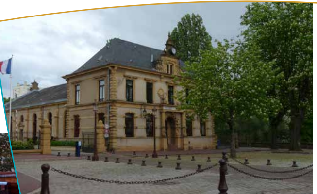
La salle Fabert