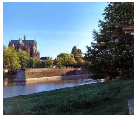
Vue depuis les lavoirs sur la cathédrale de Metz

salle Fabert, la Préfecture, ainsi que l'Opéra-Théâtre et la place de la Comédie, classés au titre des Monuments Historiques, sans oublier le pont Moreau et le pont Saint Marcel. L'ensemble du site appartient au secteur sauvegardé de la ville de Metz.