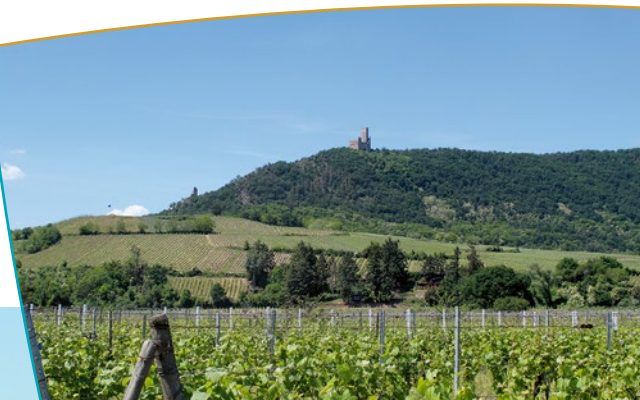
Vue sur les châteaux depuis Scherwiller