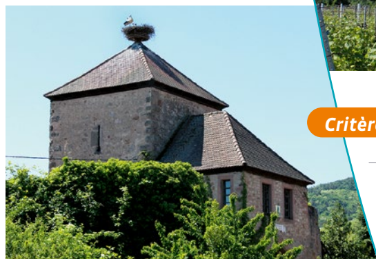
Nid de cigogne à l'entrée de Dambach-la-Ville

châteaux alsaciens comme : Guirbaden, Ottrott, Landsberg, Spesbourg, Andlau, Ortenbourg, Ramstein, Frankenbourg et Bilstein surplombent le piémont. Les vestiges de ces bâtisses représentent des lieux d'histoire et de légendes à sauvegarder et à mettre en valeur.