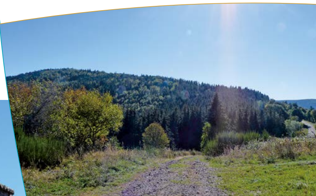
Paysage depuis les abords de la carrière