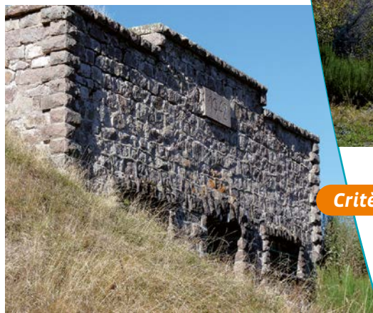
Bâtiment vue depuis le bas

Ce site historique est composé d'une carrière et d'anciens baraquements d'exploitation dans un milieu naturel et sauvage. Le site est remarquable du point de vue paysager. Les abords sont essentiellement forestier et le silence qui y règne, renforce l'ambiance mémoriale du site. La perception des lieux est très importante et sa charge émotionnelle est largement véhiculée par la lecture brutale et tragique des éléments constituant l'ensemble du camp. Le rythme des saisons contribue aussi de façon importante à la perception du site. L'exposition plein Nord du camp, la configuration actuelle des carrières et l'altitude accentuent en hiver l'ambiance de la tragique histoire des lieux.