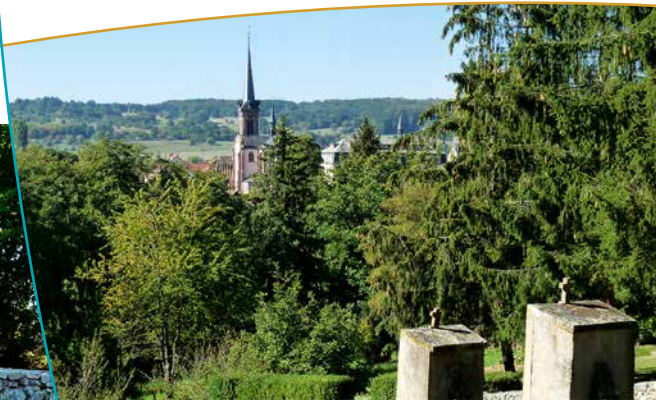
Vue sur le village depuis le chemin de croix