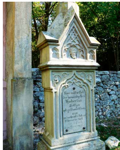
Stèle à côté de la crucifixion

village, ainsi que sur le fond de vallon, dont le village de Heiligenberg.