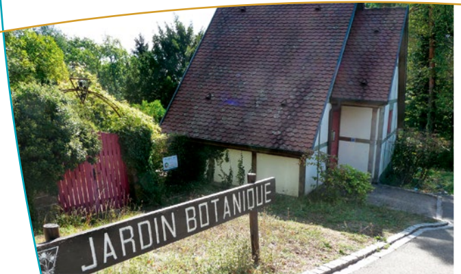
Entrée du jardin botanique

la légende du Prince Charles de Lorraine, surplombe cette route. En 1774, celui-ci partit chasser en forêt lorsqu'il se retrouva soudainement au bord du rocher, face au vide. Ne pouvant freiner à temps sa monture, il fit un saut d'une douzaine de mètres et atterrit sain et sauf en bas. Les traces des quatre fers du cheval sont visibles en contrebas, bien qu'il paraît plus vraisemblable qu'elles furent creusées par l'homme !