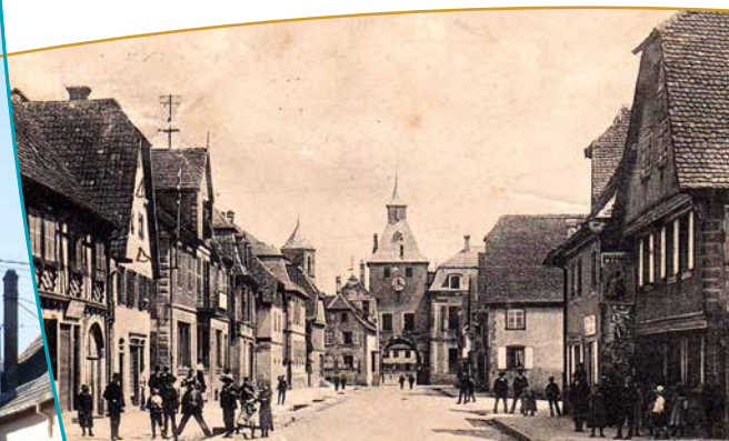
Carte postale ancienne de la place de l'Hôtel de Ville