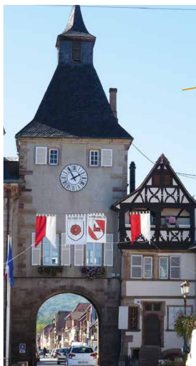
Vue sur la Niederstadt vers la porte du Millieu

Sur la place de l'Hôtel de ville se trouve un puits à six seaux, dit Sechseimerbrunnen, datant de 1605. Trois colonnes soutiennent une charpente triangulaire qui permettait de supporter le système des six seaux. Ce puits a été utilisé par les Rosheimiens jusqu'en 1906.