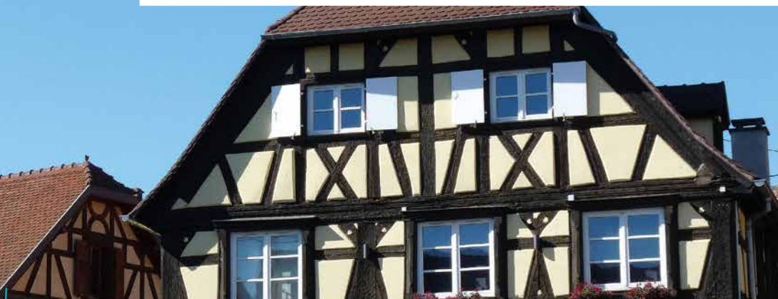
Périmètre du site