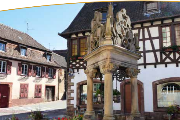
Puits et maison vigneronne