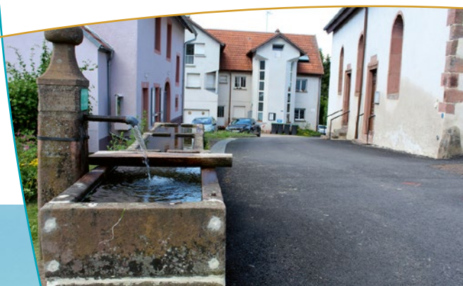
Fontaine à proximité de l'église