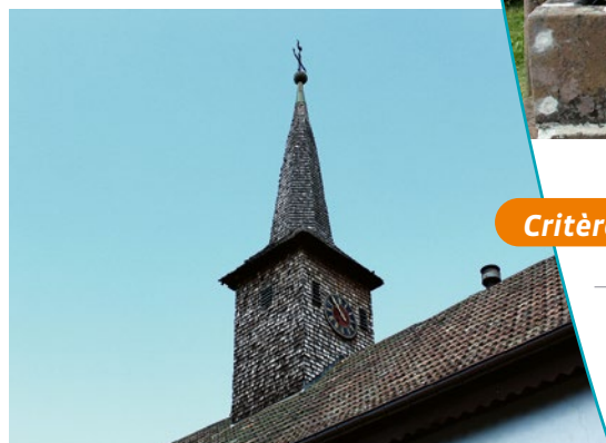
Clocher de l'église

siècles. Point d'appel dans le paysage, l'église oriente les perspectives et plusieurs points de vue depuis les accès principaux du village.