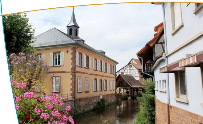
La Sauer et le lavoir

de la première moitié du XVIII ème siècle. La Grand-Rue et la rue de l'Église présentent de beaux alignements de pans de bois, et les ruelles reliant ces deux axes recèlent de plus d'un édifice intéressant. De part et d'autre du cours de la Sauer, dont la partie centrale autour du lavoir est très pittoresque, de belles maisons bordent les tracés sinueux des rues de la Monnaie et du Moulin. La majorité de ces maisons sont à pans de bois ; certaines présentent un beau décor en pierre sculptée. À proximité du château, l'ancienne grange dîmière date du XVIII ème siècle et abrite l'école.