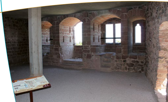
Vue de l'intérieur du château

temps la maison du régisseur implantée en contrebas dans les vignes, en limite du village. Il y élève un manoir dans le style dépouillé du Directoire qui contraste avec l'architecture gothique de l'ancien château. Le baron d'Empire conçoit un parc paysager à l'anglaise qui s'articule sur les accidents de terrain et les deux constructions. En regroupant les essences en vogue à l'époque à la périphérie d'une vaste pelouse, il a permis de dégager des perspectives ascendantes vers le vieux château.