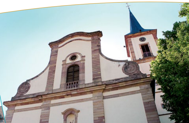
Église Sainte-Marguerite de Geispolsheim