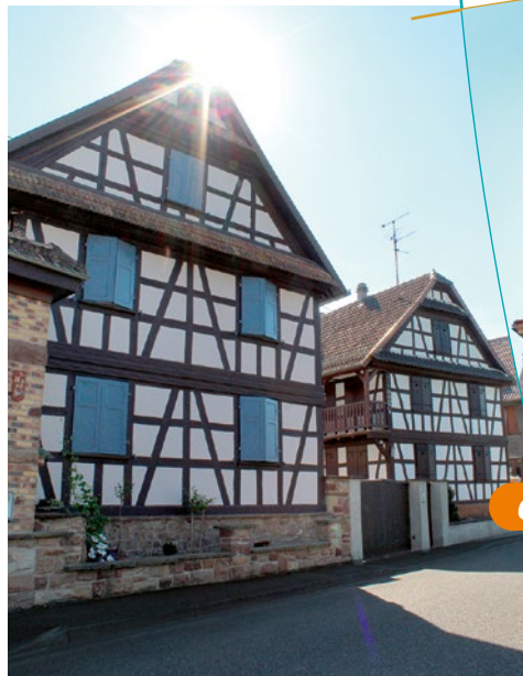
Rue du Maréchal Leclerc

Le bourg, connu depuis le Haut Moyen-Age, a appartenu jusqu'à la Révolution aux évêques de Strasbourg, qui le donnèrent en fief successivement aux « landgraves » (titre de princes souverains allemands) de la Basse-Alsace et aux familles nobles des Zorn et des Beger. Incendié à plusieurs reprises, le bourg fut toujours reconstruit dans le style traditionnel de la région et conserve une saisissante unité. Geispolsheim possède, avec une belle église du XVIII e siècle, la maison probablement la plus ancienne de l'Alsace. La plupart des maisons en pans de bois, typiques avec leurs pignons à double ou triple auvents, ont été construites entre la fin du XVII e et le début du XIX e siècle.