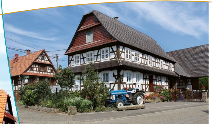
Maison alsacienne à triple auvents