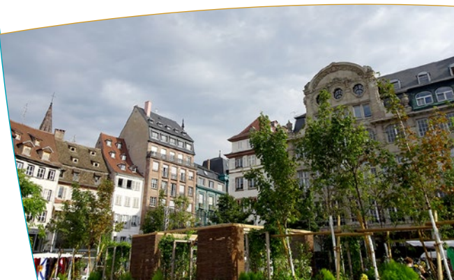
Bâtiments entourant la Place Kléber

Karl-Roos-Platz du nom de Karl Roos (en français Charles Roos), autonomiste alsacien qui devint proche des idées nationales-socialistes durant l'entre deux guerres et qui, accusé d'espionnage au profit de l'Allemagne, fut fusillé en février 1940. La place est bordée sur son flanc nord par l'Aubette, bâtiment néo-classique construit au XVIII ème siècle dans le cadre du plan d'embellissement Blondel. La rue des Grandes-Arcades (en allemand An den Gewerbslauben ) est une rue du centre-ville de Strasbourg, qui relie la rue de la Mésange à la place Gutenberg. Elle compte plusieurs édifices remarquables, dont plusieurs maisons à arcades, auxquelles elle doit son nom.