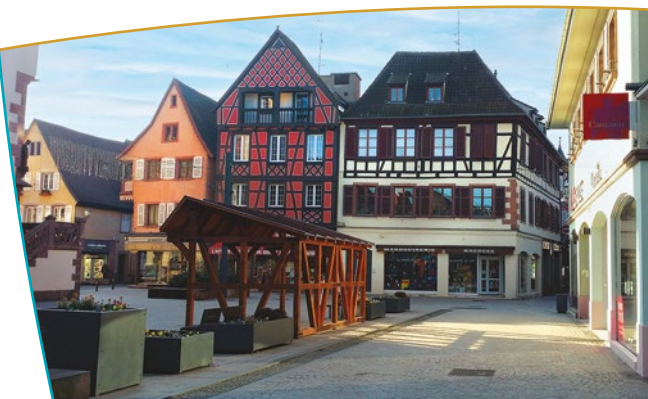
La place de la Victoire

urbaine de Sélestat puisqu'on lui reconnaît une grande valeur paysagère. Aisé à identifier par sa morphologie, les limites de la vieille ville se calquent sur la ceinture des boulevards, héritées des anciens remparts, dont il subsiste encore quelques vestiges (Porte de Strasbourg, rempart Vauban). Le centre-ville regroupe les ensembles architecturaux les plus anciens, notamment dans la partie Nord de la vieille ville qui s'est constituée à partir du XIII ème siècle. La quasi-totalité des monuments de l'époque médiévale (Églises Sainte Foy et Saint-Georges, établissements monastiques...) s'y localisent.