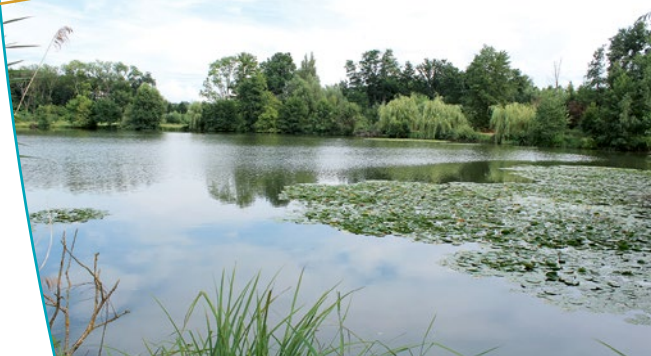
La pièce d'eau et la végétation environnante

rond » apparemment en eau, au milieu duquel se situait un îlot. Après 1760, un jardin à l'anglaise s'ajoute à ces aménagements. Liés au sort du château, dès la fin de la Révolution les jardins sont abandonnés. Un tiers du parterre jouxtant l'édifice disparaît lors de la construction du canal de la Marne au Rhin (1845). Aujourd'hui, la perspective pour laquelle le site a été classé a disparu. Tout l'espace entre le château et la pièce d'eau a été comblé par le développement d'industries, de locaux commerciaux, d'une voie ferrée, d'habitations, d'entrepôts.