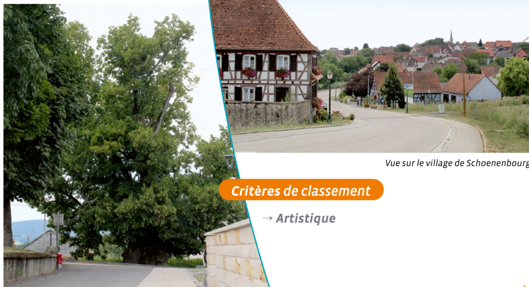
Vue sur le village de Schœnenbourg

Cet arbre aurait été planté pendant la grande Révolution (vers l'année 1791). Son tronc noueux, la puissante couronne qui le caractérise, confèrent à l'arbre une superbe majesté. Les puissantes charpentières ont obligé la mise en place d'un petit système d'étais fait de « bracelets » et de fils métalliques. La position de l'arbre au carrefour de trois voies permet plusieurs perspectives vers le tilleul, lequel participe largement à la mise en valeur de l'église qui se détache à l'arrière. De par sa localisation dans un carrefour, de sa proximité avec l'église ainsi que du banc localisé à ses pieds, ce tilleul constitue un lieu de rencontre.