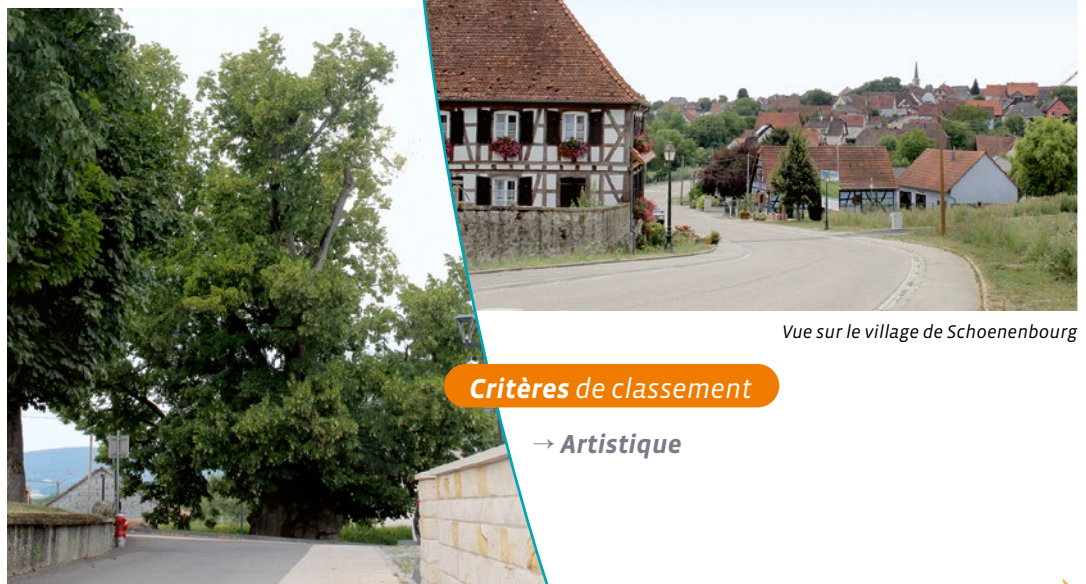
Vue sur le village de Schoenenbourg

Cet arbre aurait été planté pendant la grande Révolution (vers l'année 1791). Son tronc noueux, la puissante couronne qui le caractérise, confèrent à l'arbre une superbe majesté. Les puissantes charpentières ont obligé la mise en place d'un petit système d'étais fait de « bracelets » et de fils métalliques. La position de l'arbre au carrefour de trois voies permet plusieurs perspectives vers le tilleul, lequel participe largement à la mise en valeur de l'église qui se détache à l'arrière. De par sa localisation dans un carrefour, de sa proximité avec l'église ainsi que du banc localisé à ses pieds, ce tilleul constitue un lieu de rencontre.