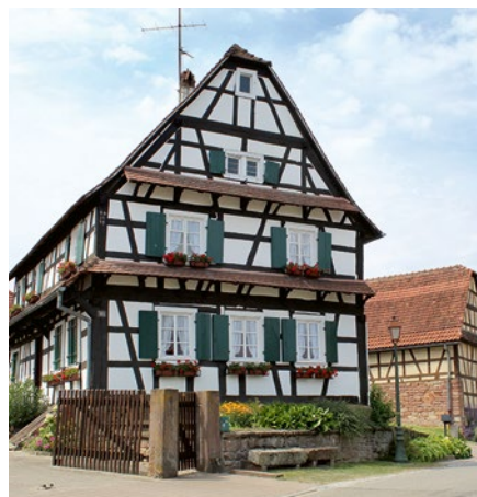
Maisons typiques, Rue des Forgerons

tant à la vue nombre de cours fermières, vergers et fontaines à balanciers. Le poutrage apparent et les auvents débordant sur les façades rythment le dessin de l'espace public.