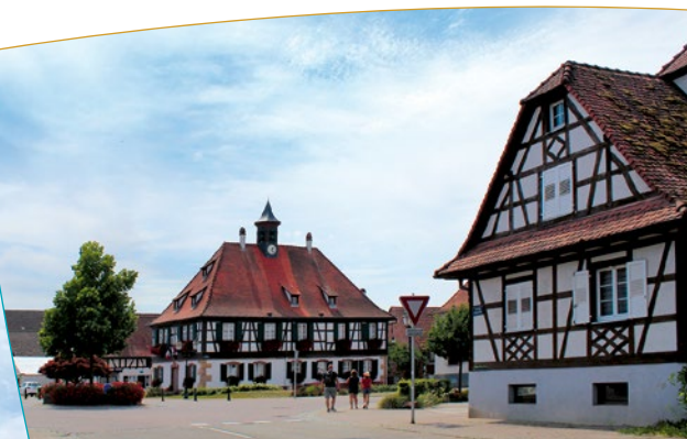
Vue sur la place de la Mairie