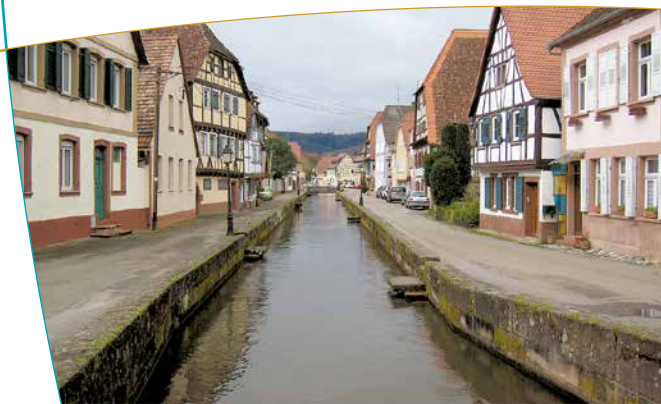
Le quartier du Bruch

l'église romane antérieure, resté accolé au flanc droit de l'édifice. Parmi les autres édifices et lieux remarquables de la ville, l'Hôtel de ville, en grès rose, avec son fronton, sa petite tour et son horloge ; la maison du Sel, reconnaissable à sa toiture divisée en auvents sous lesquels des lucarnes s'ouvrent en balcons ; l'église Saint-Jean avec son architecture allant du roman au gothique ; le vieux quartier du Bruch avec plusieurs maisons du XVI ème siècle ; le jardin Stanislas et la sous-préfecture qui occupe un élégant pavillon de la fin du XVIII ème siècle ; la grange dîmière de l'ancienne abbaye et l'ancien hôpital résidence du roi Leszczyński de 1719 à 1725.