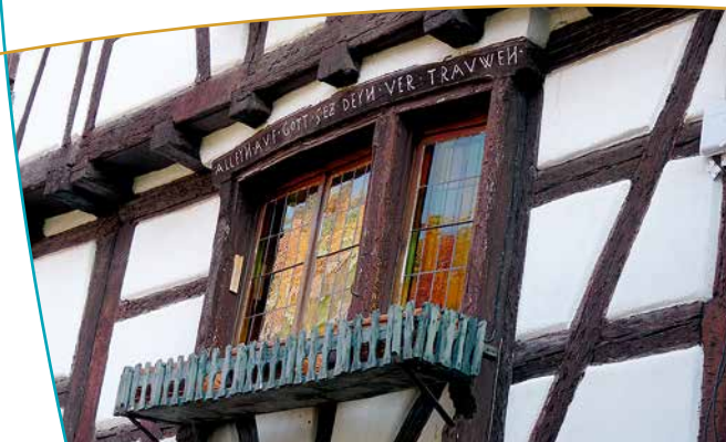
Épigraphe sur colombages

Enfin, les cours dîmières témoignent de la richesse de certaines abbayes et couvents. Elles étaient le lieu de commerce des producteurs du village : ventes, achats, échanges et prélèvement de la dîme.