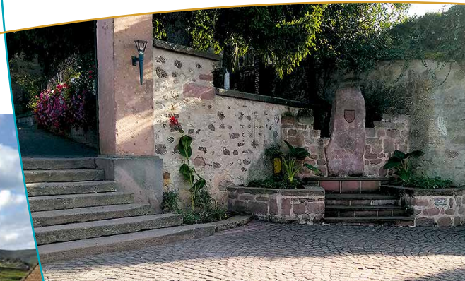
Vue de la stèle au mur du cimetière