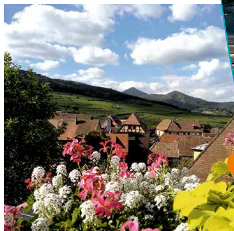
Vue du village, du vignoble et du massif vosgien

ou XIII ème siècle. L'église primitive remonte au X ème siècle. Elle sert de lieu de cultes protestant et catholique.