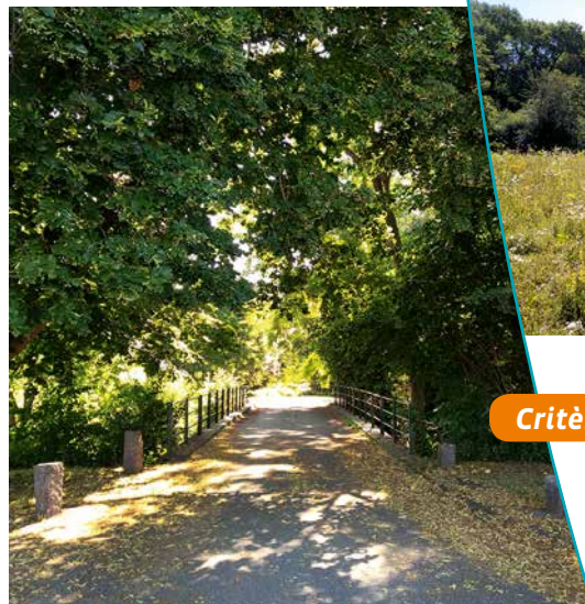
La route et le pont menant vers la forêt

C'est une forêt exceptionnelle de 309 ha de type continental formée par une chênaie-charmaie. La nature géologique du sol, les conditions climatiques et hydrologiques ont contribué au développement de petites clairières naturelles sous la forme de pelouse sèche de type steppique dont l'extension a été favorisée par des pratiques agricoles anciennes. Elle est un vestige de la forêt domaniale de la Hardt et constitue un ensemble naturel exceptionnel, unique en France et rare en Europe de l'Ouest. Le massif boisé est une rupture dans la plaine agricole.