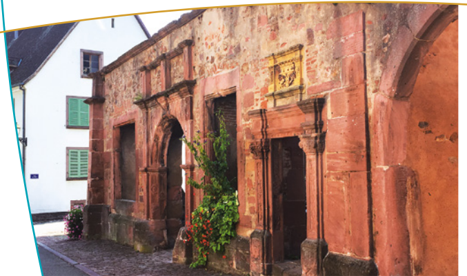
Façade de l'ancien Hôtel de Ville

La Grand Rue se termine à l'ouest par la Chapelle St Wendelin, restaurée dans les années 1990.